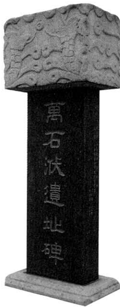
1894년 갑오농민전쟁의 발단이 되었던 만석보의 유지비(전북 정읍시 이평면)

우리는 농업기반공사 나주지사를 벗어나 천주교 나주성당을 찾아갔다. 바로 이곳이 두 차례의 대규모 나주농민대회가 열린 장소이다. 성당을 찾았을 때 하늘은 다시 눈을 흘뿌리기 시작했다. 정문에서 성당까지의 진입로는 폭이 넓지 않았다. 왼쪽에는 기와로 지붕을 올린 집이 있는데 박씨의 설명에 따르면, 농민대회 당시 사람들이 그 지붕까지 올라가