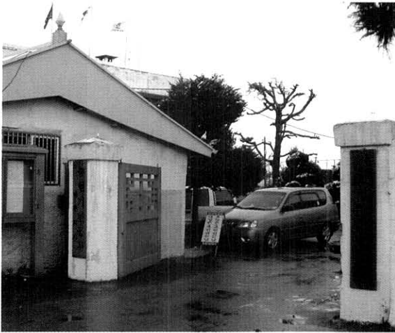
농업기반공사로 통폐합 되기 이전의 농지개량조합은 수리시설의 관리와 수세 징수를 하였다.

토론을 벌였지요. 결국 그들에게 뭔가를 가르치려 하지 않았어요. 스스로 문제를 인식하고 스스로 해결책을 만들어내도록 도와줬을 뿐이지요.”