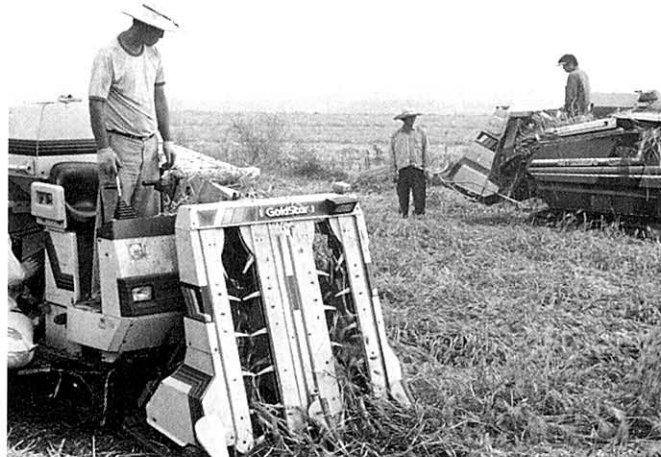
나주는 수세거부투쟁의 진원지일뿐 아니라 그 뒤에도 계속 많은 변화를 일구어 갔다.

박씨는 나주역까지 배웅해 주었다. 다시 눈발이 흠날리기 시작했다. 영산강이 휘감아 흐르는 곳. 한겨울에도 배꽃이 피어나는 곳. 박씨는 나주에 대한 인상이 어땠는지 모르겠다며 수줍어했다. 달리 무슨 대답이 필요하랴. 머리와 어깨에 내려앉은 눈