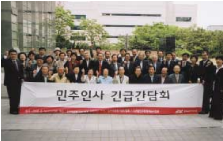
지난달 14일(수) 민주화운동기념사업회에서 열린 민주인사 긴급간담회