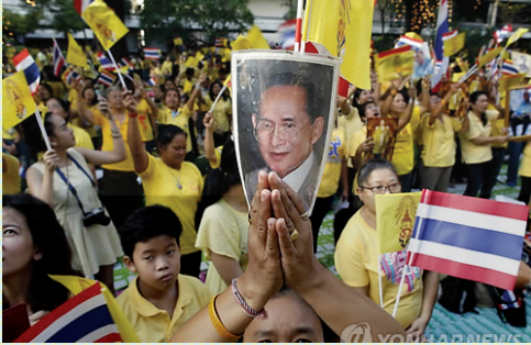
* 태국의 보수 성향 옐로우셔츠 시위대

, . ‘ , ’ ‘ ( ) , ’ ’ ( ) . 2006 가 ‘ , ’ . , ‘ , ’ , NGO 가 가 . 1960 ‘ 가 2006 9 . “ ” 가 . 1973 10 가 . 1980 ‘ , ’ 가 가 15 , 112 . 가 가 , .