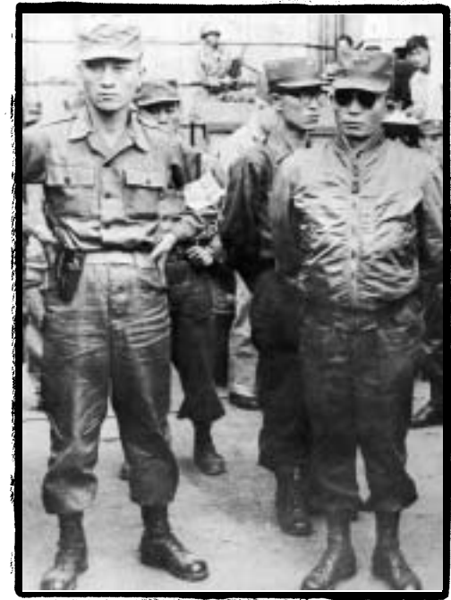
●●● 군사 정권이 시작된 5·16 군사쿠데타 당시 박정희

국민들은 야망에 두들겨 맞는 처지에 처해진 이 비상사태와 연관하여 남한 대화를 유신체제로로 추진