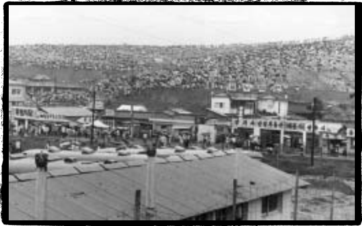
... 시위에 참여하기 위해 모여든 광주대단지 사람들

①민들의 ÷ CEL 불만은 1971년 8월 경기도 광주대단지 ,, 동으로 ] z ± 다. 광주대단지사 1 은 < 국의 무모한 - 발= 획과 주민들의 현실을 h 면한 행정태도, ①부05의 실h을 보여주는 단CE인 사5€다. 광주대단지 소요사 1 은 도시 ①민지역에 대한 < 국의 경= Š 을 자극하€다. 8한 1960년대 A부터 도시 ①민ÿ에 y Š 을 - 고 ①민지역에서 | * Ž 동을 해오던 성직자들에 대한 < 국의 ² • 을 ° 화시@는 요인이 되었다.