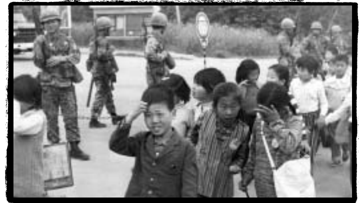
••• 위수령으로 겁먹은 체 등교하는 초등학생들

1971년 1월 27일 문* 부는 대 j * { * + 의 대,, E 인 ° 화를 발] 하 € 다. 대 j 을 " • 으로 만들고 j 생들을 " • 안에 가두어 두려고 나 | 것이었다. j 생들은 이를 B 민족 안보를 위한 것이 아니라 정_ 안보 H 를 위한 것이라고 반발하며 Q 일 * { 반대