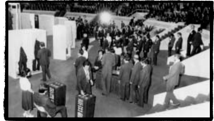
... 장충체육관에서 대통령 간접선거에 참여하고 있는 통일주체국민회의

입법부의 독자(ε 역할을 무력화시@기 위해 국회의 국정2사 _을 cĪ 했고, 대통b에8 국회 해ñ_을 부여한 반면 국회에는 대통b² Ī _을 부여하지 ; D다. 국회는 국무Ö리와 국무 위원에 대한 ~\ (ε인 해P Ô의를 할 $ 있었지만, 국회는 항