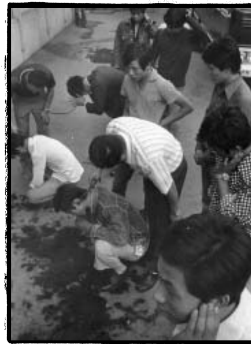
●●● 거리에서 강제 이발당하는 시민들

거리에서는 장발 단속을 하는 경찰들이 가위를 들고 젊은이 들을 a 아다니고, 미니스' | 단속을 위해 자를 들고 아가e 들 의 '마길을 재기도 했지. 어느 날 내가 à아했던 가$가 대 마±를 G±다는 이유로 î UX전과 라디오에서 사라î ±리 고, 가사가 불1 전하다는 이유로 à아하던 노래를 더 이h 들을 $도 부를 $도 i 8 되었을 때는 얼마나 속이 h했던지…….