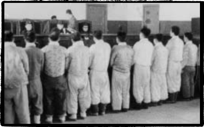
*** 재판장 판결을 듣고 있는 인혁당사건 관련자들

국제법" 가뵐회는 인É< y{ 자들이 처¼L 4월 9일을 '사 법사h Ôv의 날'로 지정했다. X날 역사는 이를 '사법a인' 으로 정의하고 국가,, 력의 한 전¼으로 구i 해 오고 있다.