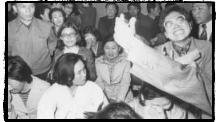
••• 사형이 확정되자 울고 있는 민청학련사건 관련 가족들

나³ 에 확인L 바에 의하면, 민청j { 이" 그 실체가 i 는 것 이었다. j 생들은 단지 자유민주주의 회Õ을 바라는 Ž화시위 를 =확했을 i 국가변" 이나 공ñÊ• 같은 것은 생k 조5 한 €이 i 었다. 대부i 의 j 생들은 ³ t 정보부에서 ™고문9전기 고문9ê 을 채우지 j 는 고문 등 가v 한 + 체€• c 을 통하여