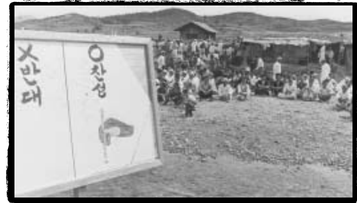
••• 찬성, 반대 안내판이 있는 3선개헌국민투표 유세장

그러나 c 정N는 j 원에 경찰” 력을 v입하고 • * b을 내리 고, 야< 의 i 열을 획) 히는 등 - 은 변D을 동원하여 3| -헌 을 2행했다. -헌안 국회 ] Ö 전달인 9월 13일 전국 33- 대j