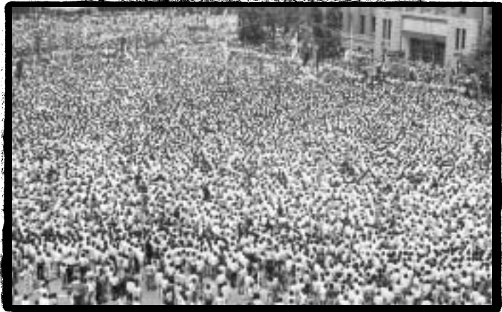
시청 앞 광장을 가득 메운 이한열 열사 추모객들