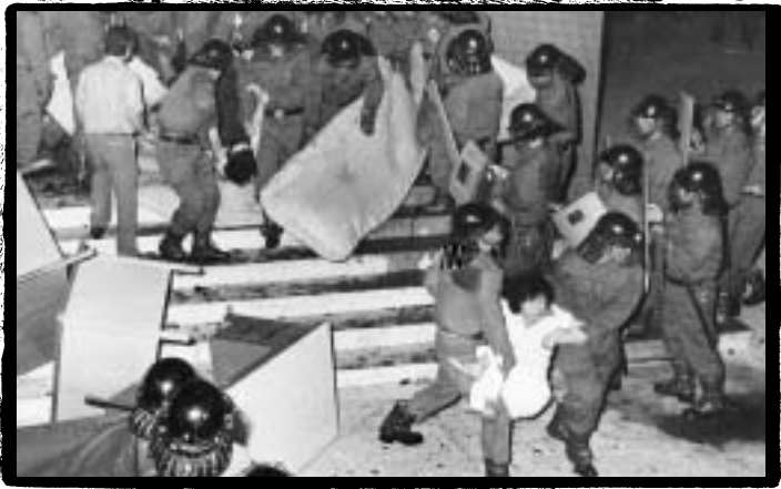
●●● YH무역 여성노동자들을 끌어내는 경찰들

에 구Y< 하여 3 경h을 입었다. 경찰은 신민< < 월 26• 을 ° 제로 Q행하€고 YH무역 노조의 신민< %성을 배후조Ó한 8 의로 인• 진, 문동> 목사 등 8• 을 구속했다.