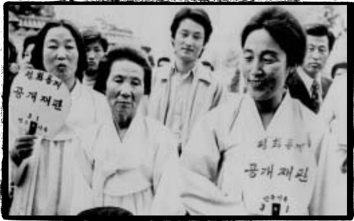
*** 구속인사 석방을 요구하는 3·1민주구국사건 가족들

조사를 6D다. Ô국 d대³ 9문x > 9서남동9이문• 9안” 무9á반M9신현Ô9문정현9문동> 9f 1M9이해동 등 11 • 이 구속 기소되었다.