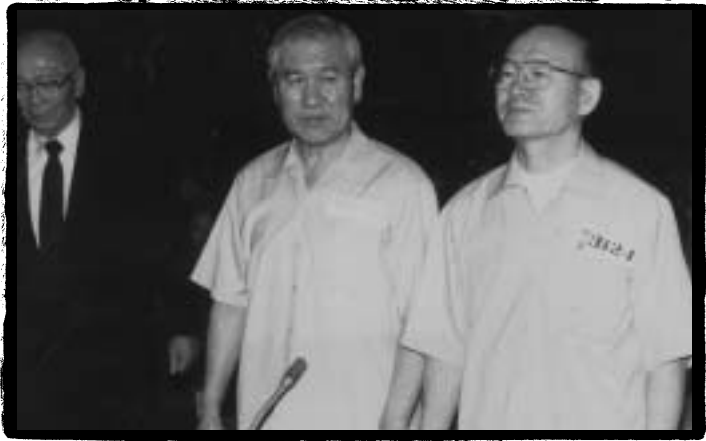
●●● 12·12 및 5·18 관련 1심 선고공판에서 피고인석에 선 전두환(오른쪽), 노태우(가운데)

다. X로소 조금 ± 보8 L 진실은 XyE이었지만, 그것도 새로움이라면 새로움이μ지.