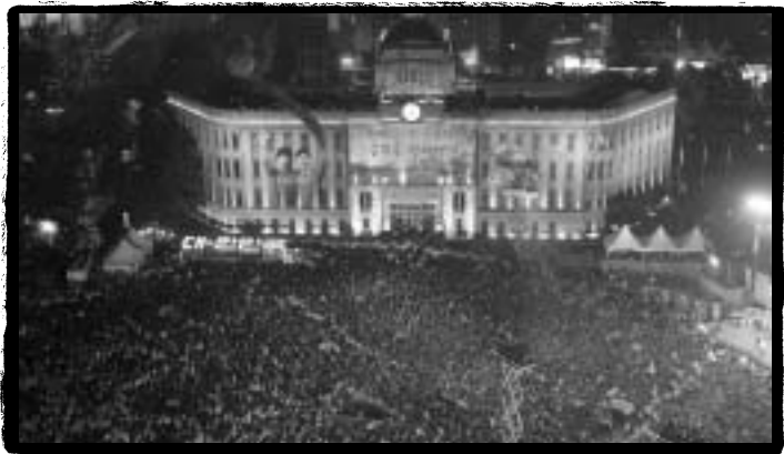
시청 앞 광장을 가득 메운 월드컵 응원 시민들