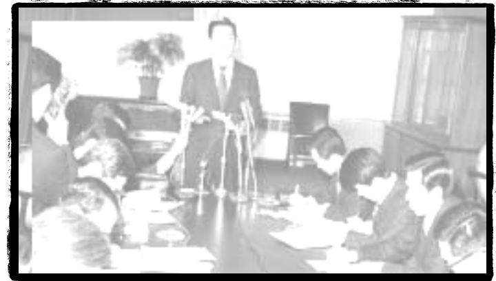
●●● 긴급조치 4호 발표