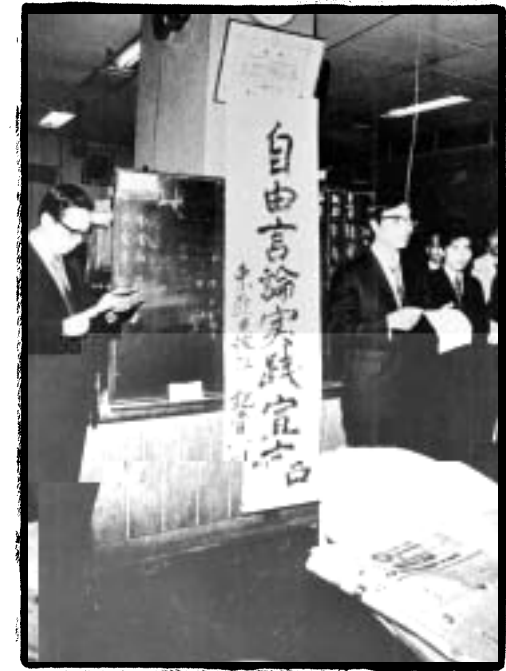
●●● 1974년 10월 24일 자유언론실천선언

기자들의 운동이 본OÆ으로 조직화되기 시작한 것은 1974 10월 19일 기자Ÿ회 회장으로 동아일보의 d” × 기자가 | z 되면서부터이다. 이후 기자Ÿ회 동아일보 지부는 10월 24일 동아일보와 동아방P 소속 기자 180여 • 이 ~ " 한 가운데 ‘자유; u실β | ; 대회’ 를 ~’ 하여β; u에 대한 h부 간ø 배제, 기y 원의 z 입 거부; ; u인의 불법 Q행 거부H등 3-항을 Ô 의했다. 이후 전국Æ으로 31- 신문9방P9통신사 기자들이 자유; u실β운동을 전-했다. 8한 기자Ÿ회는 ñ하에 ; u