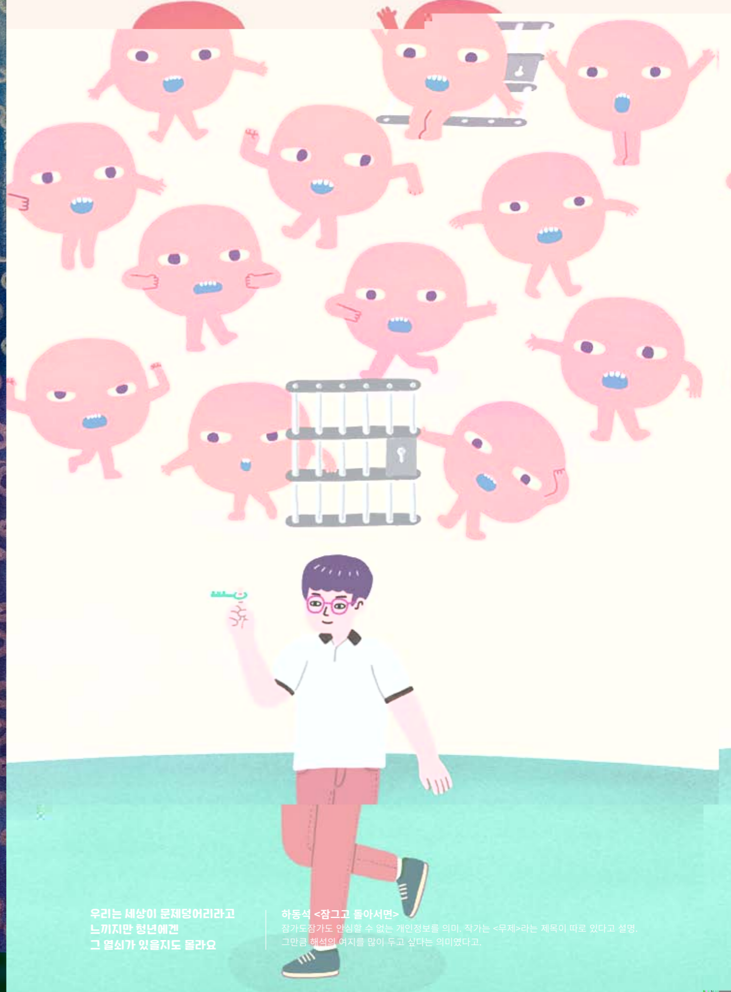
우리는 세상이 문제덩어리라고 느끼지만 청년에게는 그 열쇠가 있을지도 몰라요