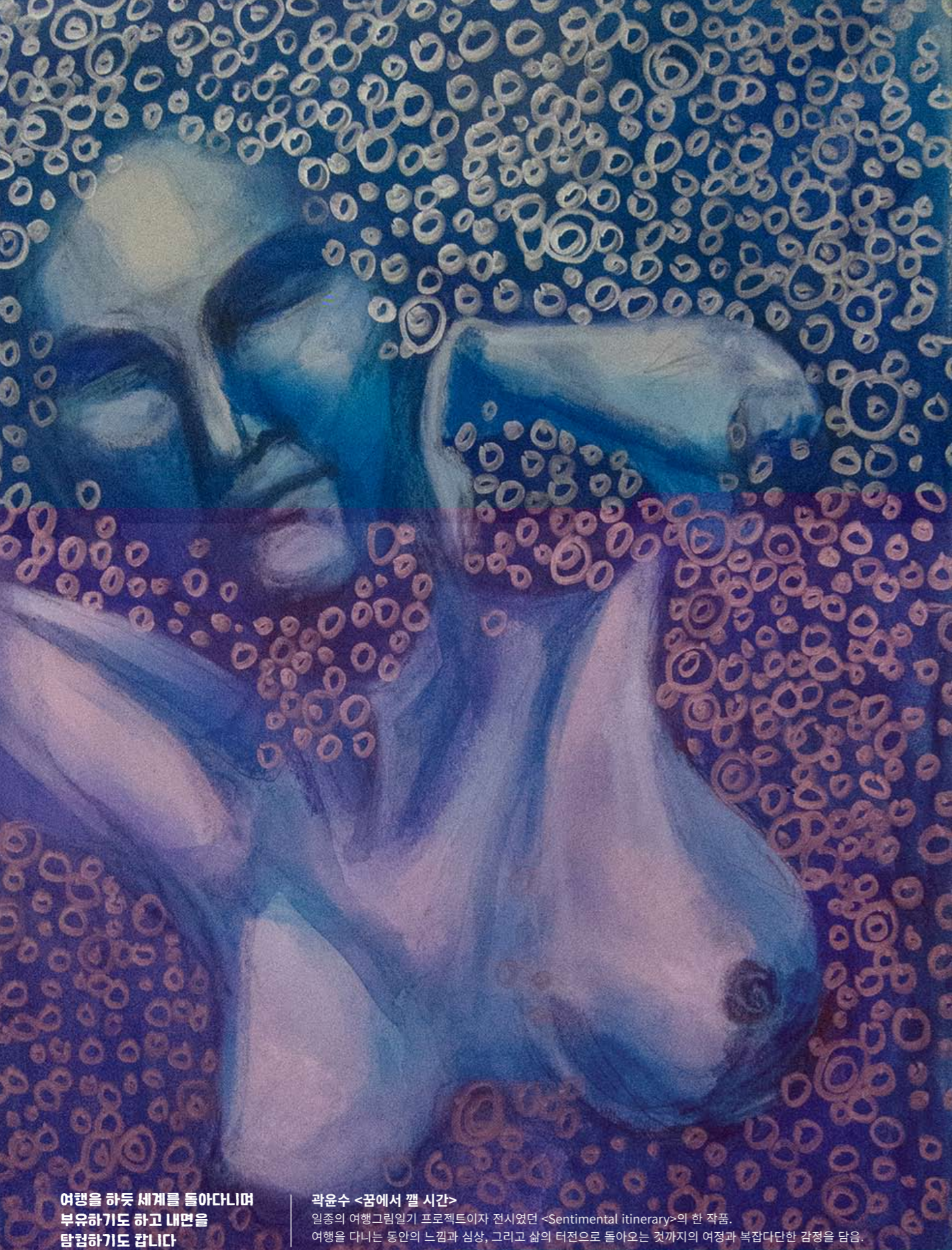
여행을 하듯 세계를 돌아다니며 부유하기도 하고 내면을 탐험하기도 합니다