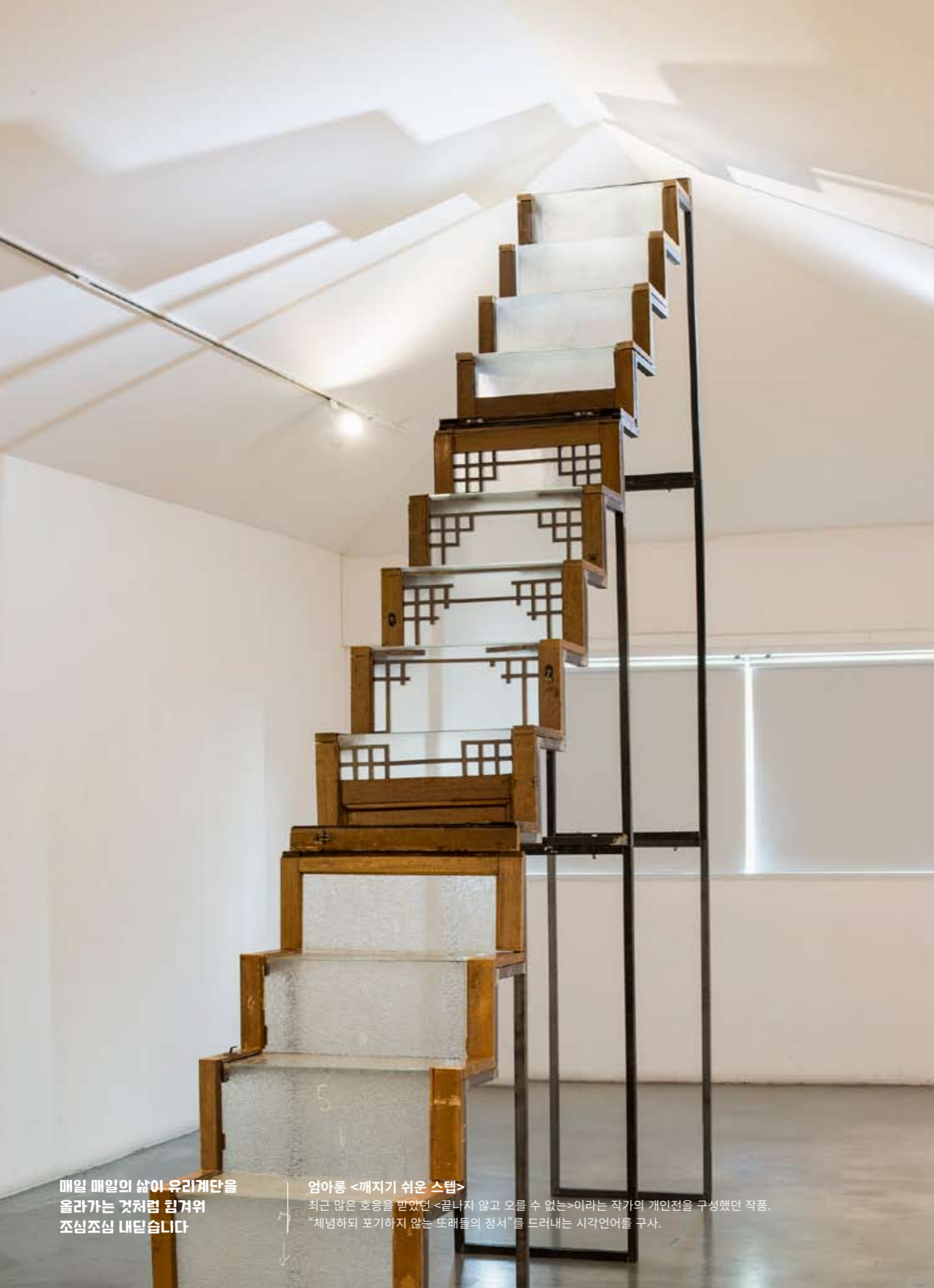
매일 매일의 삶이 유리계단을 올라가는 것처럼 힘겨워 조심조심 내딛습니다